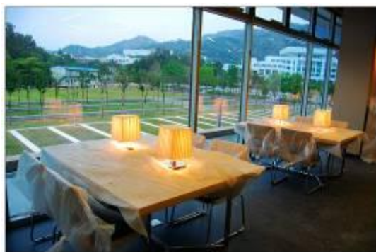
靠近校园的阅览室,落地窗,可纵览校园风光。桌面的台灯为空间分界线。

汕大新图书馆的设计体现着“人与自然和谐相处”的意味。比如图书馆的外墙是土黄色,不同于汕大其它建筑外墙的纯白,